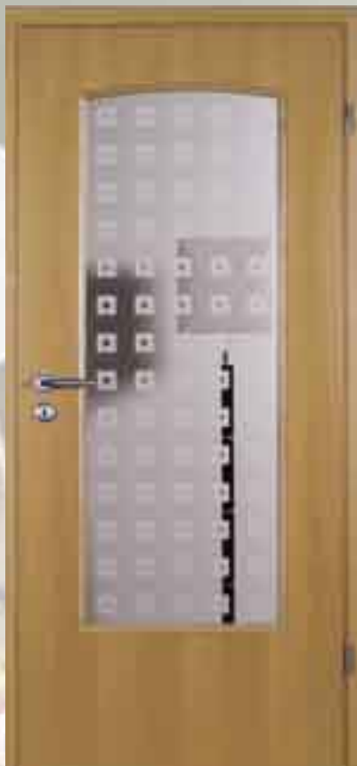
Glasrahmen • Modell: „Soltau“ Buche natur • Stilprofil Verglasung: Klarglas mit Sandstrahlmotiv Drücker: R11B