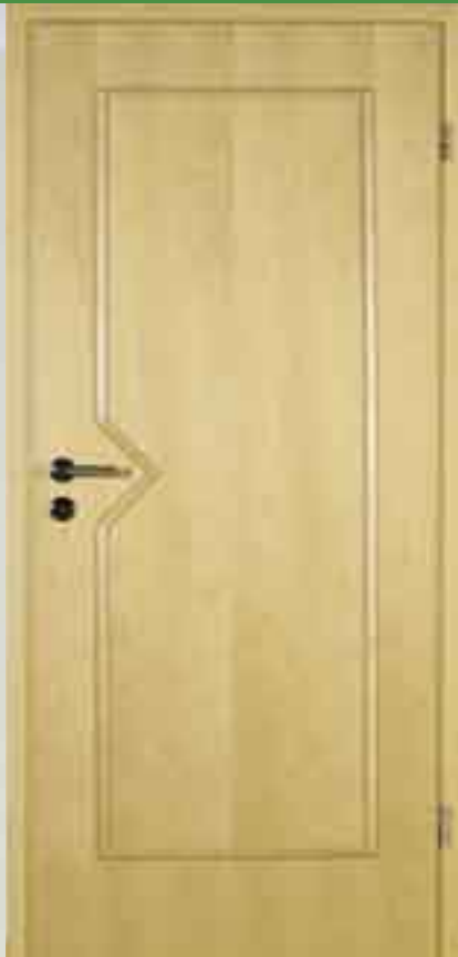
Auflegerahmen Modell: „Erie“ Ahorn natur • Rundprofil Drücker: R01B

Für die Gestaltung geschlossener Türblätter haben wir die Step-Auflegeteisten und -rahmen entwickelt. Sie werden einfach auf die Oberfläche der Tür aufgebracht und verwandeln die Ausstrahlung Ihrer Räume im Handumdrehen. Gerade bei vorhandenen Türen ist dies eine beliebte Methode um neue Akzente zu setzen.