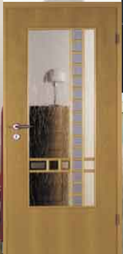
Sprossenrahmen • Modell „Arles“ Buche natur • Rundprofil Verglasung: Gothik weiss, Leiter Float blau mit Facette und 3 Felder Madras Uadi mit Facette Drücker: R11B