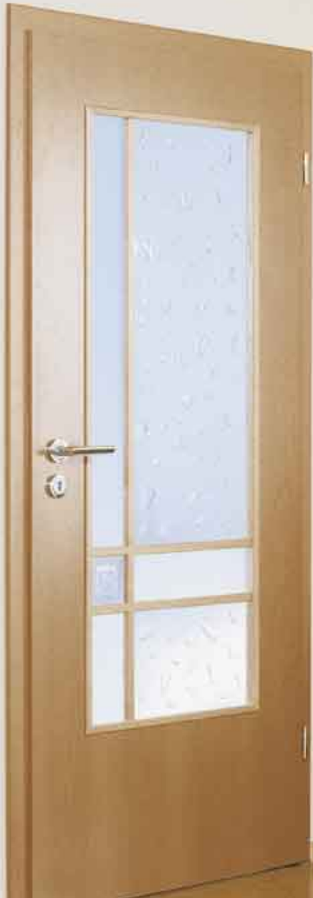
Sprossenrahmen • Modell „Kopenhagen“ Buche natur • Softlineprofil Verglasung: Schmelzglas und satiniertes Glas Drücker: R01C

Bei der Ausgestaltung Ihres persönlichen Lichtausschnittes durch Step-Sprossenrahmen und Step-Glasrahmen sind Ihnen wenig Grenzen gesetzt. Neben den beliebten Holzarten Buche, Ahorn und Eiche erhalten Sie die Modelle natürlich auch in weiß lackiert und in vielen weiteren Holzarten. Unser umfangreiches Know-how in der Glasverarbeitung rundet die Vielschichtigkeit der Auswahl ab. Ob Sandstrahltechnik, Rillenschliff, Siebdruck, Schmelzglas, Fusing oder Lasertechnik - „Step“ bietet modernste kreative Bearbeitungstechniken mit Stil.