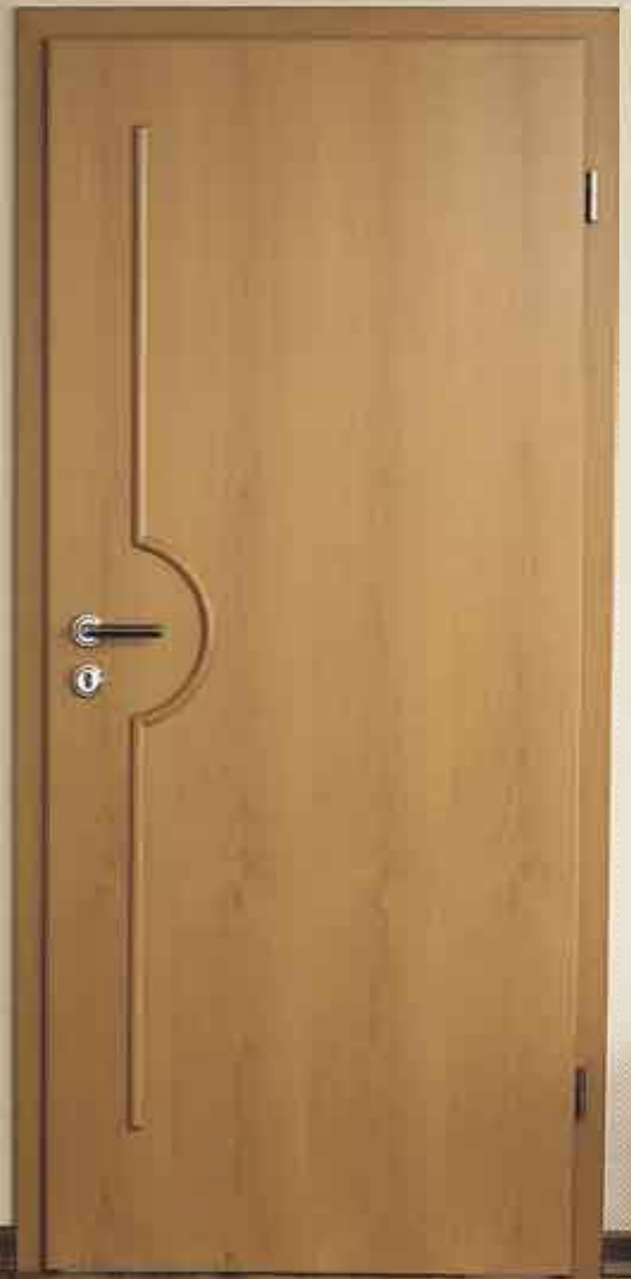
Auflegestab Modell: „Bali“ Buche natur • Rundprofil Drücker: R04A