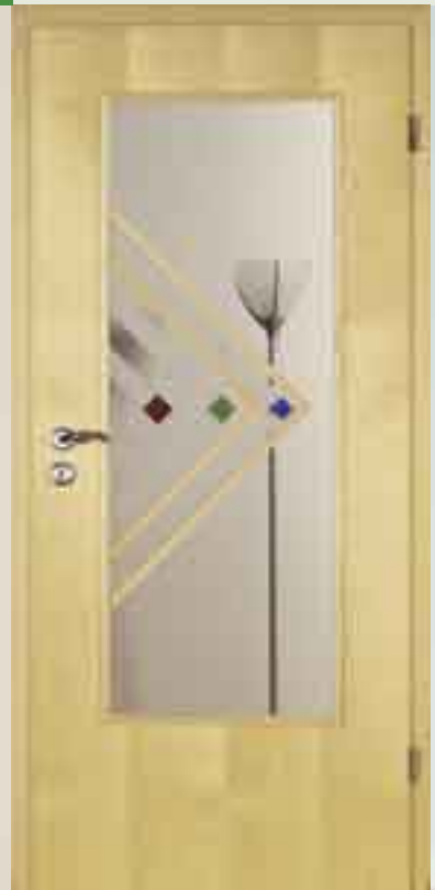
Sprossenrahmen Modell „Florenz“ Ahorn natur • Softlineprofil Verglasung: Float klar mit Sandstrahlmotiv und farbigen Facettensteinen Drücker: R012B