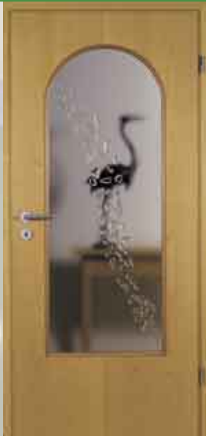
Glasrahmen • Modell: „Kempen“ Buche natur • Stilprofil Verglasung: Schmelzglas Drücker: R01B

Geschlossene Türblätter verhindern, dass sich Licht in Wohnräumen verbreiten kann. Oft entstehen so dunkle Räume, die durch eine andere Türegestaltung taghell geworden wären. Lichtausschnitte eröffnen Ihnen die Möglichkeit das Tageslicht optimal zu nutzen und dennoch nur so viel Einblick zu gewähren, wie Sie möchten. Alle Step-Lichtausschnitte sind neben dem DIN-Maß auch individuell planbar.