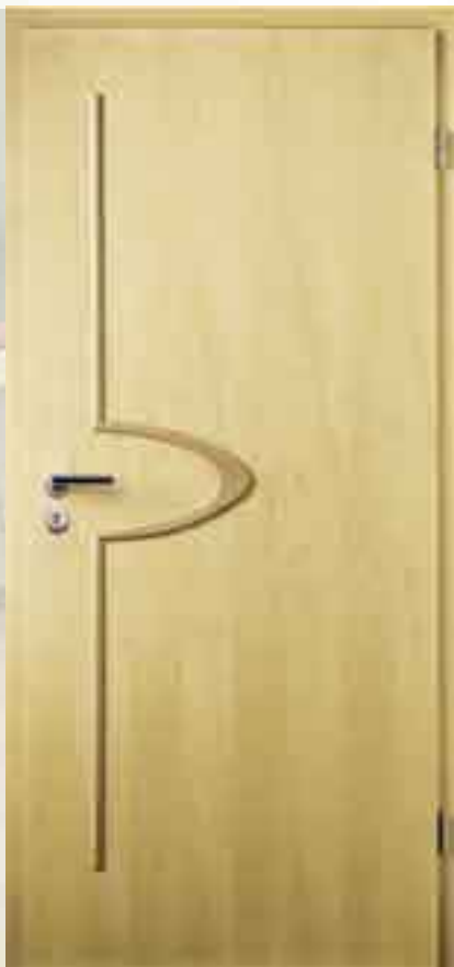
Auflegestab • Modell: „Oakland“ Ahorn natur • Profil Listello Drücker: R01B