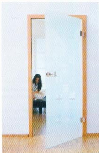
Beispiel aus der Loft-Kollektion

Piktura GmbH 33161 Hövelhof Tel 0 52 57/9 79 50 Fax -- /97 95 25 www.piktura.de