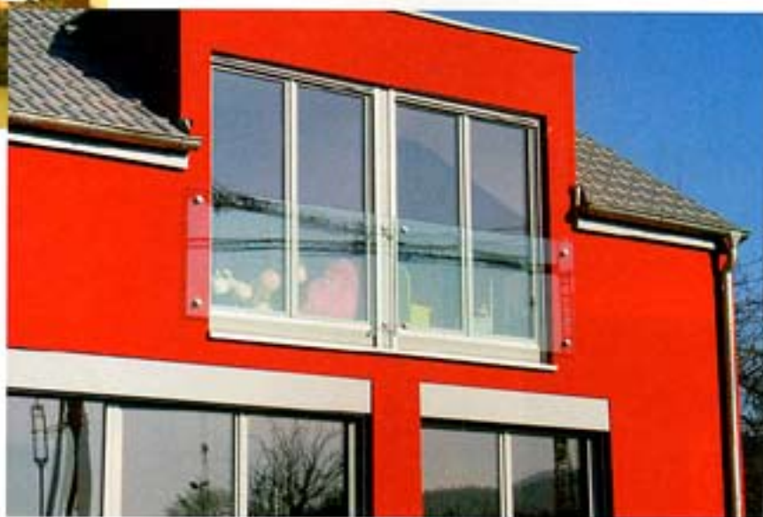
Neben Glas-Innentüren bietet das Unternehmen auch Absturz- und Brüstungsverglasungen.

Unter dem Namen »Loft Fashion Doors« sind eine Reihe von Türen für den Wohnbereich sowie das Objekt entstanden, die erstmals ein geschlossenes Türenkonzept darstellen. Von der Tür fürs Wohnzimmer über die Küche bis hin zum Arbeitszimmer greift die dezente Gestaltung ineinander und wird zum Leitmotiv für das gesamte Haus. Jedes Symbol kann wahlweise auf Float-Glas, Satinovo oder lackiertem Glas aufgebracht werden.