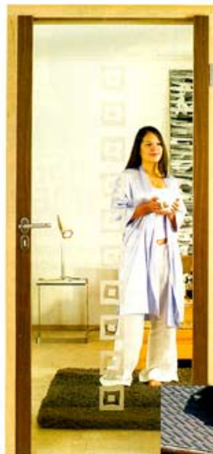
H20 mit Glüstür 3052, Float klar, einseitig sandgestrahlt mit Holzriegel in Nussbaum.

verfügt über einen leicht laufenden Klemm-Laufwagen mit spezieller Rollentechnik sowie einem verstellbaren Mechanismus zur waagerechten Montage. Auch nach Montage der Glasscheiben ist eine Höhenregulierung von 10 mm immer noch gegeben. Bei mehrflü-