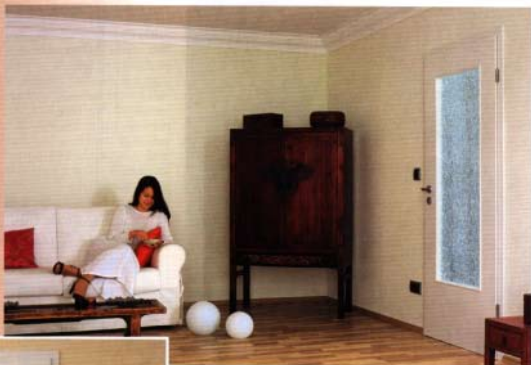
Was aussieht wie eine zu Bruch gegangene Scheibe ist das Ergebnis langwieriger Tests.

Im Zuge der Vergleichbarkeit von Produkten und immer preissensibleren Kunden ist jeder Händler froh, wenn er über Produkte verfügt, deren Nutzen so individuell ist, dass sie für den Kunden einen eher ideellen als einen materiellen Wert darstellen.