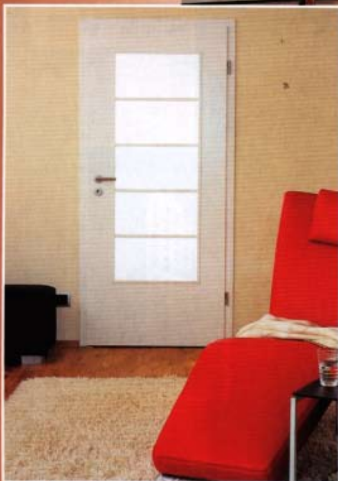
Das Modell Nürnberg besticht durch die klare Linienführung.

Step, Pikturas Marke für Sprossen- und Glasrahmen sowie Auflegeleisten, bedient eine solch profitable Lücke im Sortimentsmix des Fachhandels. Doch auch Produkte die von der Marge her für den Händler interessant sind verkaufen sich nicht von alleine. Dem Vorbild der Glas Türenmarke „Loft“ folgend hat Piktura ( www.piktura.de ) daher nun auch für die Marke „Step“ ein umfassendes Konzept zur Verkaufsförderung am PoS aufgelegt.