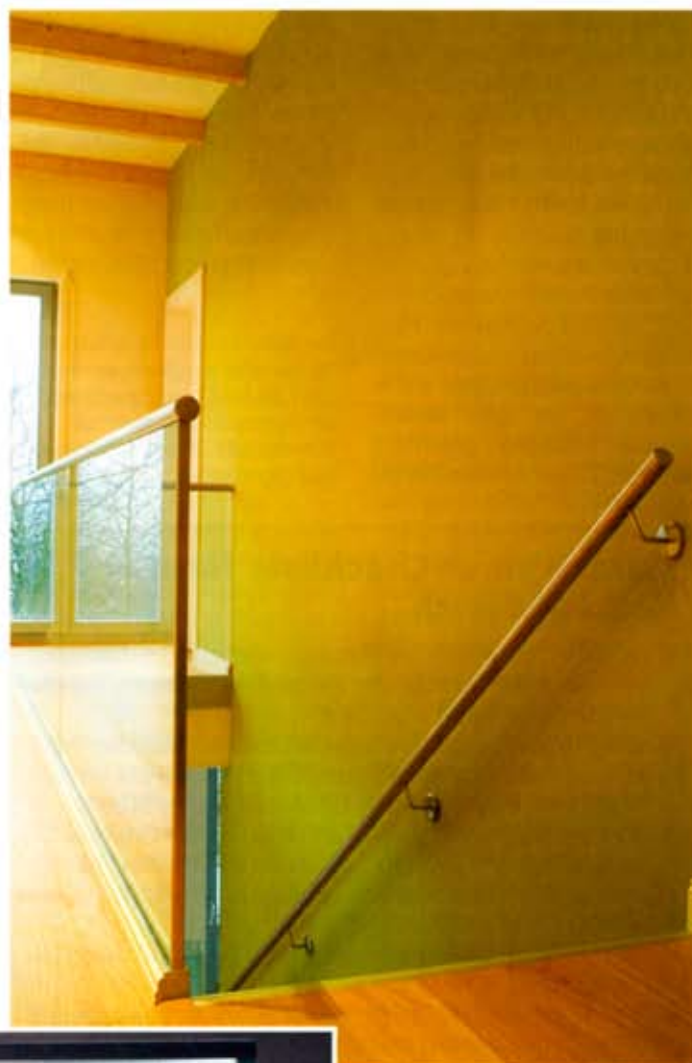
Die Glasbrüstung sorgt für viel Helligkeit beim Treppenausgang.

Unter dem Namen Loft Fashion-Doors sind eine Reihe von Türen für den Wohnbereich sowie das Objekt entstanden, die erstmals ein ge-