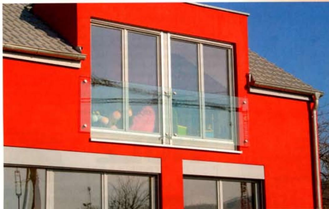
Eine Absturzsicherung, die freie Sicht garantiert.

Das gängigste Bauelement im Außenbereich zur Verwendung von Glas ist nach wie vor das Vordach. „Hier bieten wir eine punktgehaltene Lösung an, die neben einem filigranen Erscheinungsbild über eine allgemeine bauaufsichtliche Zulassung verfügt. Das bietet unseren Kunden ein Höchstmaß an Komfort, da keine Zustimmung im Einzelfall über den Behördenweg erwirkt werden muss.“