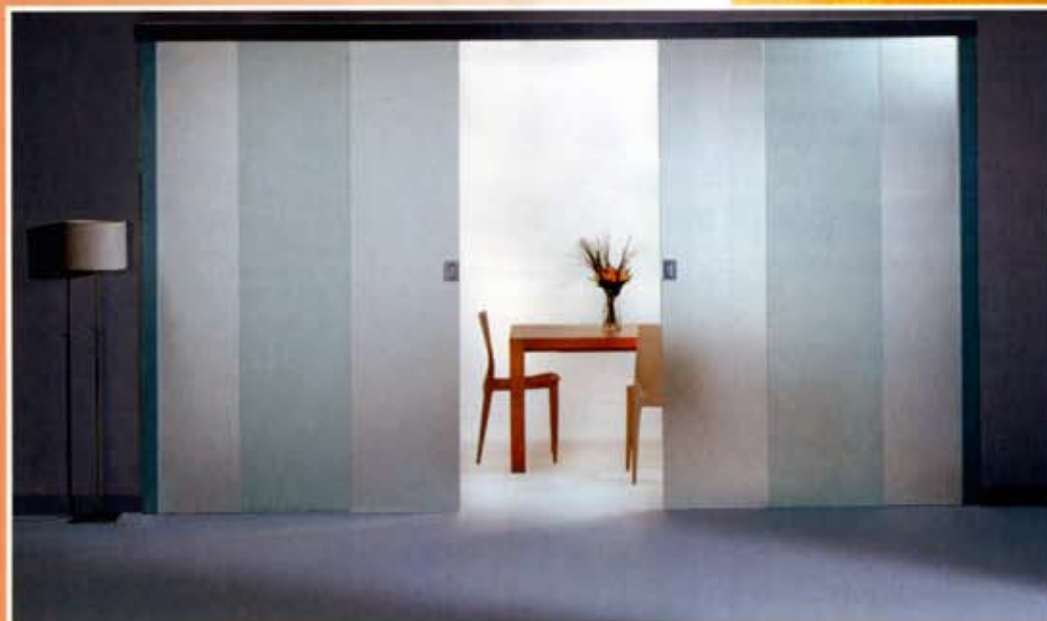
Immer häufiger greifen Architekten bei der Gestaltung von Innenräumen auf Schiebetüren zurück.

schlossenes Türenkonzept darstellen. Von der Tür fürs Wohnzimmer über die Küche bis hin zum Arbeitszimmer greift die dezente Gestaltung ineinander und wird zum Leitmotiv für das gesamte Haus. Jedes Symbol kann wahlweise auf Float-Glas, Satinovo oder lackiertem Glas aufgebracht werden. Piktura plant, diese Serie auch über die Publikums- und Presse zu vermarkten, da sie besonders junge designorientierte Menschen ansprechen soll.