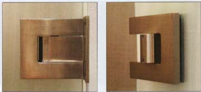
Pendeltürbeschlag „V-708“ in Funktion