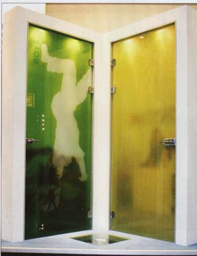
Links die sandgestrahlte Tür, rechts die „Nanotec“-Beschichtung

Als Vorlagen für derartige Türegestaltungen können jegliche Arten von Bildern, Fotos und Kunstwerken benutzt werden. Die Möglichkeiten für Planer wie auch Private sind bei dieser Technik nahezu unbeschränkt. Wichtig ist laut Verkaufsleiter