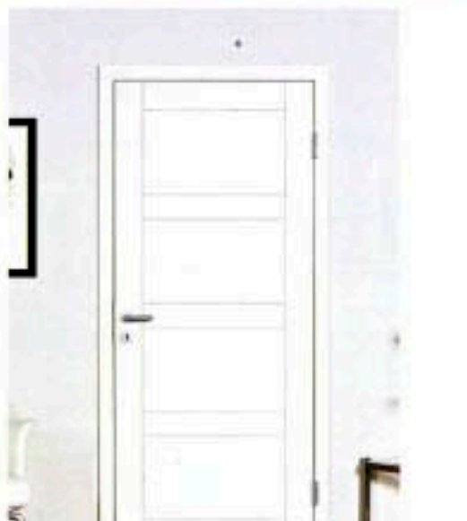
Klares Design: Weiße Tür mit Schleiflackoberfläche, mit Falz oder flächenbündig, aus der Kollektion Mediterran , ca. 1070 Euro