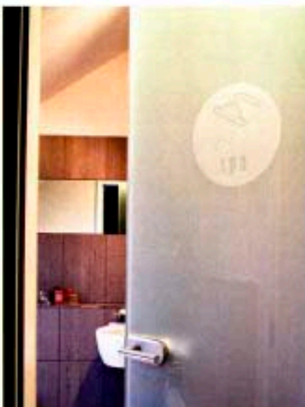
Blickdicht fürs Badezimmer: Satinierte Glas-tür mit eingprägtem Motiv spa aus der Kollektion Loft fashion Doors , ca. 450 Euro